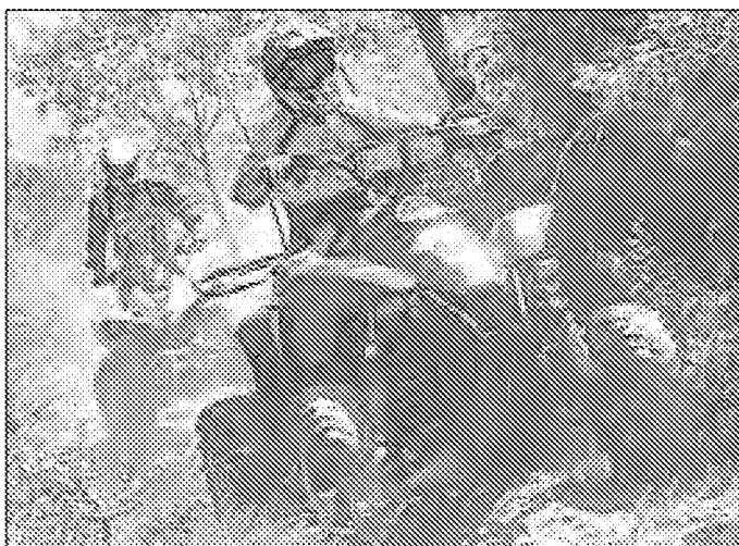
Un momento della Motocavalcata di Miscoso del 26 giugno