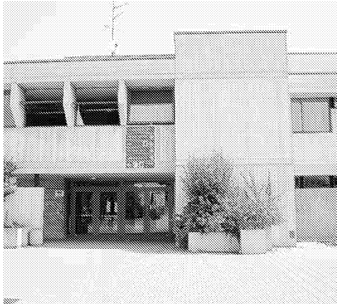
Il palazzetto dello sport di Cavriago

«Questo sistema - spiega l'assessore - deve essere salvaguardato, soprattutto, dalla scarsità di risorse finanziarie che a causa della crisi ancora in atto diventano sempre più ri-